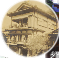
夕闇に佇む外観はなつかしさにほっとする