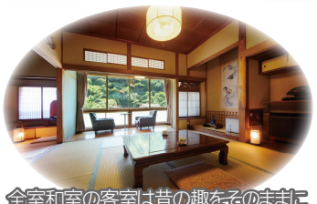
全室和室の客室は昔の趣をそのままに